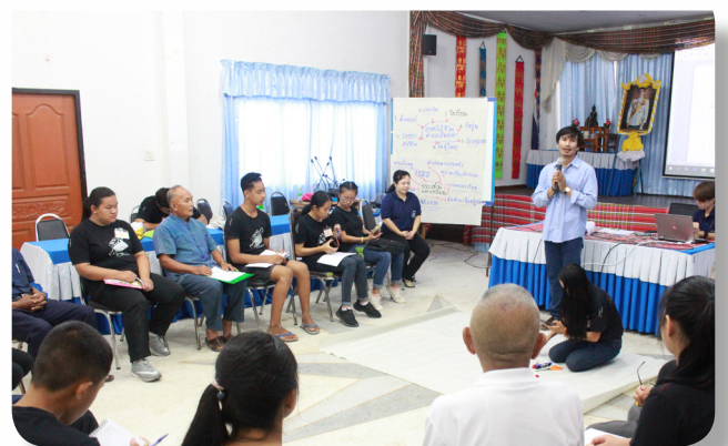
ประชุม AAR หลังการจัดเวทีประวัติศาสตร์ชุมชน และวางแผนต่อยอดการทำงาน

ทุกครั้งหลังจากเสร็จการดำเนินงานหรือกิจกรรม มูลนิธิฯ จะมีการประชุมกับทีมงานของชุมชนเพื่อสรุปบทเรียนและทบทวนการดำเนินงาน เพื่อปรับปรุง พัฒนา การดำเนินงานในครั้งต่อไปให้ดีขึ้น การประชุมนี้จะช่วยพัฒนาให้ทีมงานในชุมชนมีการพัฒนางานให้มีประสิทธิภาพมากยิ่งขึ้น