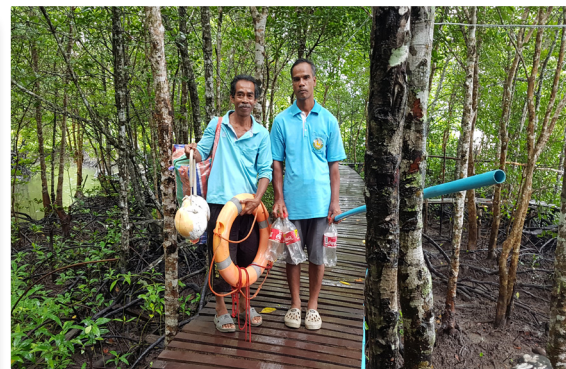
ครูสอนว่ายน้ำในชุมชน

ปี 2557 พัฒนาสู่การมุ่งเน้นให้เด็กมีทักษะการเอาตัวรอด (ตะโกน โยน ยื่น) หลังจากโรงเรียนและชุมชน มีการดำเนินงานเพื่อให้เด็กในชุมชนว่ายน้ำเป็น ในปี 2557 โรงเรียนและชุมชนได้รู้จักแนวคิดเรื่องทักษะการเอาตัวรอดทางน้ำจากศูนย์วิจัยเพื่อสร้างเสริมความปลอดภัยในเด็ก โรงพยาบาลรามาธิบดี จึงเริ่มมีแนวคิดที่จะให้เด็กในชุมชนมีทักษะการเอาตัวรอดทางน้ำ