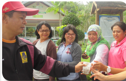
ซ้อมดับเพลิง