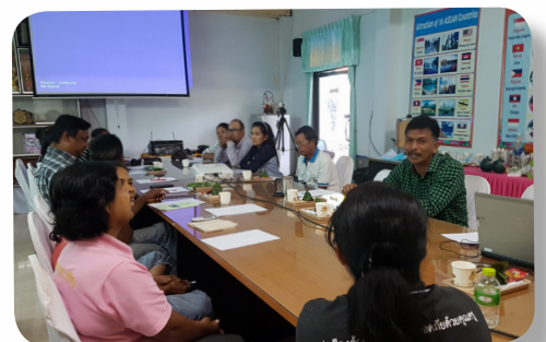
ประชุมวางแผนป้องกันและแก้ไขความเสี่ยง

ประชุมวางแผนป้องกันและแก้ไขความเสี่ยงเมื่อวาดแผนที่แล้วให้ผู้เดินสำรวจแต่ละกลุ่มปรึกษาหารือกันถึงแนวทางการแก้ไขปัญหาจุดเสี่ยงร่วมกันซึ่งจะประกอบไปด้วยแนวทางการแก้ไขปัญหา ผู้รับผิดชอบในการประสานงานหรือแก้ไขปัญหา