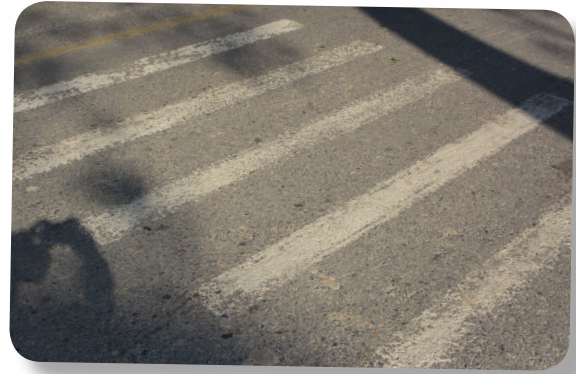
ตีเส้นทางม้าลาย

จากการดำเนินงานตั้งแต่ปี 2558 เทศบาลตำบลสันมะค่า ได้ดำเนินงานตามกรอบการทำงานชุมชนคุ้มครองเด็กทั้ง 3 ด้าน คือมีการดำเนินงานส่งเสริมความปลอดภัย มีการส่งเสริมพัฒนาเด็กและครอบครัวและมีการดูแลช่วยเหลือเฝ้าระวังและคุ้มครองเด็กและครอบครัว โดยมีรายละเอียดการดำเนินงานดังนี้