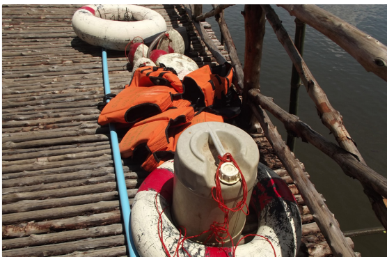
อุปกรณ์การเรียนเพื่อความปลอดภัย