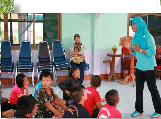
โรงเรียนพูดคุยกับเด็กเรื่องความปลอดภัยทางน้ำ