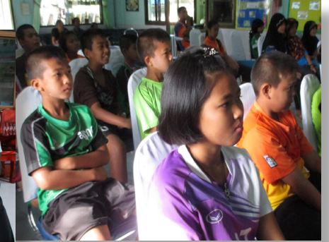
คัดกรองเด็กว่ายน้ำเป็น/ไม่เป็น