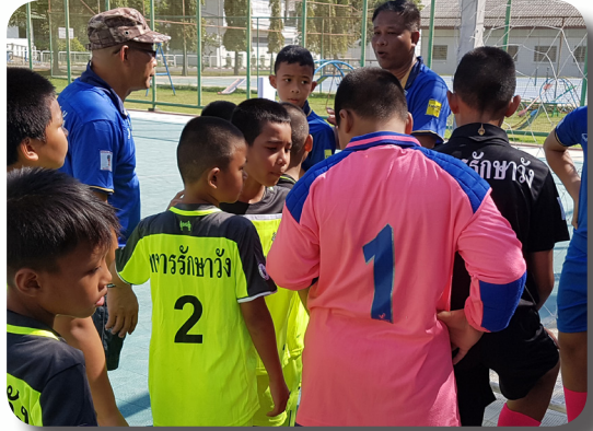
แกนนำชุมชนทหารรักษาวังสอนฟุตบอลให้เด็ก