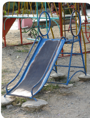
การสำรวจสนามเด็กเล่นที่ชำรุด