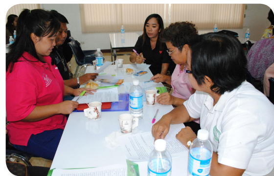
อบรมพัฒนาทีมคณะทำงาน