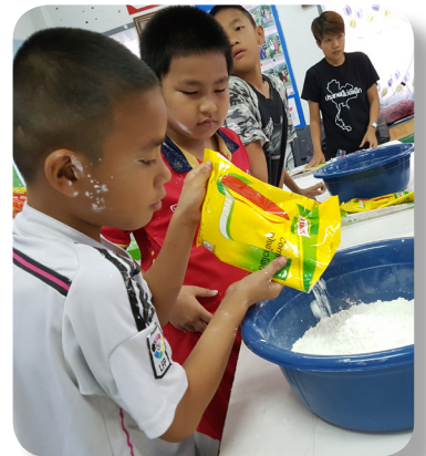
เครือข่ายพ่อแม่อาสาทำกิจกรรมกับเด็กในชุมชน