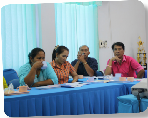
ประชุมแนวทางการทำงานลดความรุนแรงกับ อบต.บ่อแดง