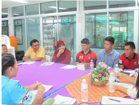
ประชุมทีมสหวิชาชีพในการให้ความช่วยเหลือเด็ก