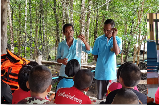
ชุมชนสอนเด็กว่ายน้ำ

1.5 ชุมชนกับโรงเรียนจัดหาสถานที่ทำสระว่ายน้ำธรรมชาติ จัดทำตารางสอนว่ายน้ำ จัดหาและทำอุปกรณ์สอนว่ายน้ำ โดยในช่วงแรกที่ยังมีเสื้อชูชีพไม่พอ โรงเรียนและชุมชนได้นำลูกมะพร้าวลิบมาผูกให้เป็นเครื่องพยุงตัว และให้กลุ่มเด็กที่ว่ายน้ำเป็น ใช้ลูกมะพร้าวช่วยในการพยุงตัว ส่วนเด็กที่ว่ายน้ำไม่เป็นให้ใช้เสื้อชูชีพในช่วงที่ลงน้ำช่วงแรก