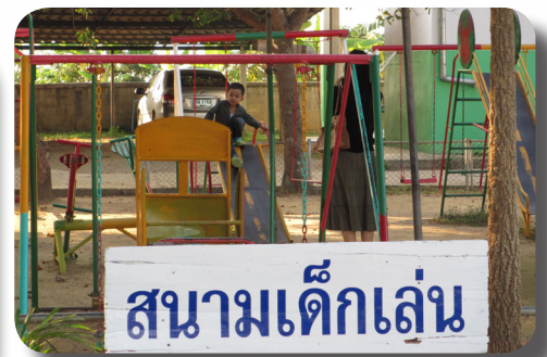
ซ้อมแซมเครื่องเล่น