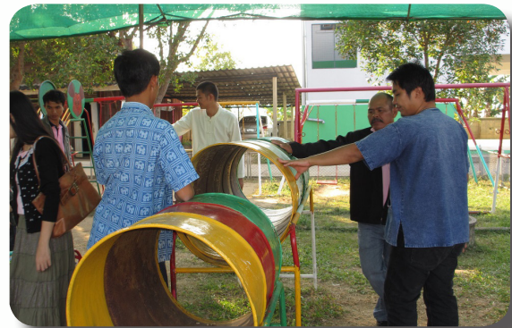
ผู้เกี่ยวข้องตรวจสอบสนามเด็กเล่น หลังการแก้ไข

ขั้นตอนนี้ถือเป็นขั้นตอนที่จำเป็น หลังจากสำรวจจุดเสี่ยง ชุมชนและหน่วยงานมีการตกลงกันว่าจะแก้ไขจุดเสี่ยงนี้อย่างไรแล้ว ทีมงานมูลนิธิฯ จะต้องลงพื้นที่เพื่อติดตามการดำเนินงาน ปรับปรุง แก้ไข ซ่อมแซมของคนในพื้นที่หรือหน่วยงานว่ามีวิธีการแก้ไขไปแล้วหรือไม่ อย่างไร หรือติดปัญหาอุปสรรคอะไร ขั้นตอนนี้จะเป็นตัวกระตุ้นช่วยให้แผนการแก้ไขจุดเสี่ยงดำเนินไปได้สะดวกมากขึ้น