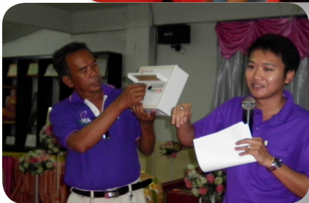
การอบรมให้ความรู้ในรูปแบบต่างๆ