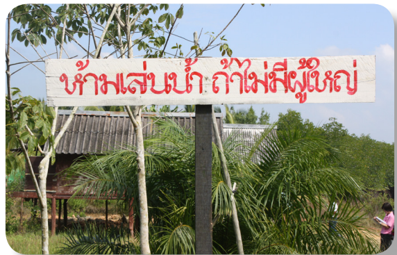
ติดป้ายเตือน