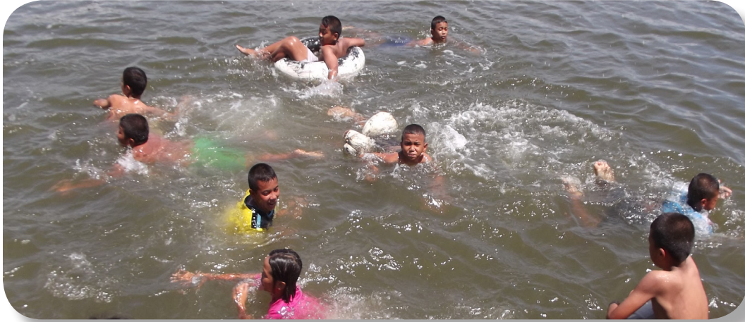
สระว่ายน้ำธรรมชาติในชุมชน