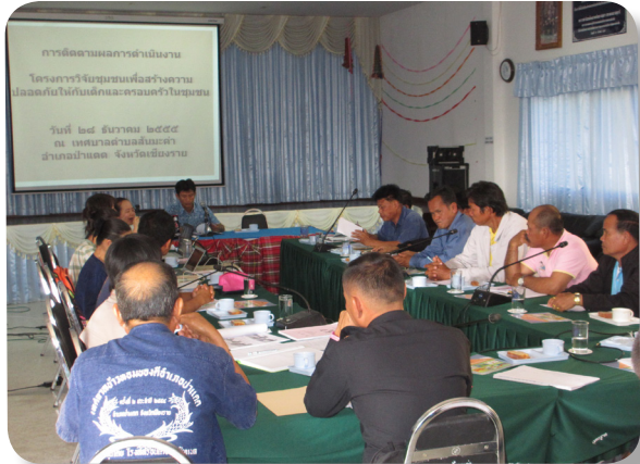
มูลนิธิฯ ลงติดตามการทำงานของ ต.สันมะค่า

ในปี 2559 มูลนิธิฯ ได้ร่วมกับเทศบาลตำบลสันมะค่าขยายผลแนวคิดและกระบวนการทำงานเรื่องความปลอดภัยในชุมชนไปยังตำบลศรีโพธิ์เงินโดยได้มีการจัดอบรมให้ความรู้และดำเนินการสำรวจจุดเสี่ยงในพื้นที่ตำบลศรีโพธิ์เงินซึ่งวิทยากรที่เป็นผู้ให้ความรู้และทำกระบวนการเป็นแกนนำเยาวชนและเจ้าหน้าที่จากเทศบาลตำบลสันมะค่า โดยมีมูลนิธิศูนย์พิทักษ์สิทธิเด็กเป็นที่เลี้ยง