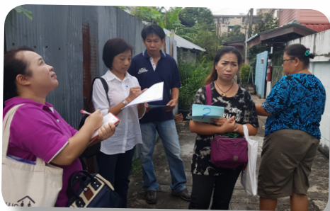
การแบ่งทีมเดินสำรวจจุดเสี่ยง

การแบ่งทีมเดินสำรวจจุดเสี่ยงในการดำเนินการสำรวจจุดเสี่ยง สมาชิกทุกคนจะช่วยกันตัดสินใจจุดนั้นๆ เสี่ยงหรือไม่และร่วมกันวิเคราะห์ว่าแต่ละจุดเสี่ยงมีความเสี่ยงอย่างไร แล้วจึงทำการบันทึกภาพพร้อมกระดาษตัวเลขซึ่งจะเริ่มจากจุดที่ 1 โดยจะบันทึกภาพพร้อมกับบวงหรือถือกระดาษหมายเลข 1 ตรงจุดนั้น เพื่อเวลาอธิบายข้อมูลจะได้ตรงกันว่าจุดใดเป็นจุดที่ 1 จุดใดเป็นจุดที่ 2 พร้อมกับการบันทึกข้อมูลลงในแบบสำรวจจุดเสี่ยง