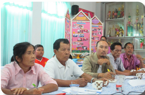
ชุมชนบ่อแดงประชุมหาแนวทางการช่วยเหลือเด็ก (หลังจากการใช้เครื่องมือ 19 ก้าวหนึ่ง)