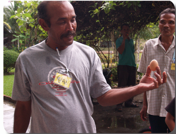
อบรมพัฒนาศักยภาพแกนนำชุมชน จ.กระบี่

ปี 2549 มีชุมชนเข้าร่วมโครงการชุมชนคุ้มครองเด็กเพิ่มขึ้นอีก 2 ชุมชน คือ ชุมชนหมู่บ้านร่วมเกื้อ เขตทวีวัฒนา กรุงเทพมหานคร และ ชุมชนบ้านคลองยาง จ.กระบี่ การเข้าร่วมโครงการของทั้ง 2 ชุมชนเป็นการติดต่อประสานงานจากมูลนิธิศูนย์พิทักษ์สิทธิเด็ก โดยเห็นว่าชุมชนหมู่บ้านร่วมเกื้อมีประธานชุมชนที่มีแนวคิดในการส่งเสริมพัฒนาเด็กเป็นทุนเดิมอยู่แล้วและประธานชุมชนมีแผนในการจัดให้เด็กและเยาวชนมีชมรมทำกิจกรรมต่างๆ ส่วนพื้นที่ชุมชนบ้านคลองยาง จ.กระบี่ เป็นพื้นที่ที่มีกลุ่มครอบครัวทดแทนที่อาสารับเด็กของมูลนิธิศูนย์พิทักษ์สิทธิเด็กไปดูแล รวมทั้งมีผู้ใหญ่บ้านและประชาชนในชุมชนมีความเข้มแข็ง มูลนิธิศูนย์พิทักษ์สิทธิเด็กจึงได้ลงไปคุยกับผู้นำและกรรมการชุมชน 2 พื้นที่เพื่ออธิบายโครงการและทั้ง สอง ชุมชนก็ได้เข้าร่วมโครงการชุมชนคุ้มครองเด็ก