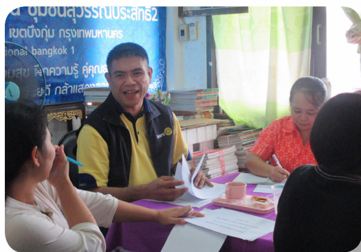
ประชุมหารือกับแกนนำชุมชน