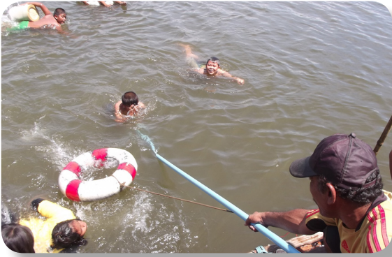
สอนตะโกน โยน ยื่น