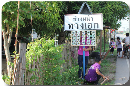
ชุมชนสนมค่าติดตั้งป้ายเตือนการใช้ถนน