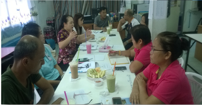
ประชุมเตรียมจัดกิจกรรม ส่งเสริมพัฒนาเด็กและครอบครัว