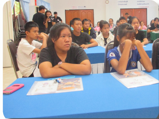
เวทีประชุมของสภาเด็กฯ

เทศบาลรับสมัครเด็กและเยาวชนจากความสมัครใจ โดยคณะเทศและวัย ซึ่งอยู่ในช่วงอายุ 12-18 ปี โดยผู้สมัครมาจากหลากหลายโรงเรียน เช่น โรงเรียนบ้านวังวิทยา โรงเรียนป่าแดดวิทยาคม ฯลฯ ผู้สมัครส่วนใหญ่มาจากคำแนะนำของสภาเด็กและเยาวชนรุ่นพี่ หรือ มาจากการชักชวนของเจ้าหน้าที่เทศบาลตำบลสันมะค่า