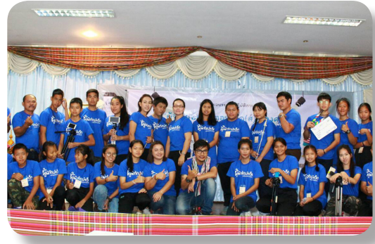
ทีมคณะทำงานสภาเด็กฯ ตำบลสันมะค่า