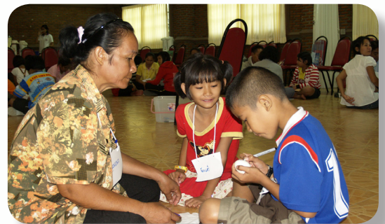
แม่ทำกิจกรรมร่วมกับลูก

ต่อมาในปี 2543 กลุ่มครอบครัวสัมพันธ์รุ่น 1 และ 2 รวมตัวกันก่อตั้งศูนย์บริการครอบครัวในชุมชนวัดพระเชตุพนวิมลมังคลาราม โดยมีพิธีเปิดเป็นทางการในวันที่ 4 พฤศจิกายน 2544 เพื่อใช้เป็นสถานที่ในการพบปะทำกิจกรรมของกลุ่มครอบครัวในชุมชน โดยมีพ่อแม่อาสาสมัครเปลี่ยนหมุนเวียนเข้ามาทำกิจกรรมให้กับเด็ก และมีเครือข่ายหน่วยงาน เช่น ศูนย์บริการสาธารณสุข 3 , 6 , 38 เข้ามาจัดกิจกรรมให้กับครอบครัว เช่น ห้องเรียนพ่อแม่