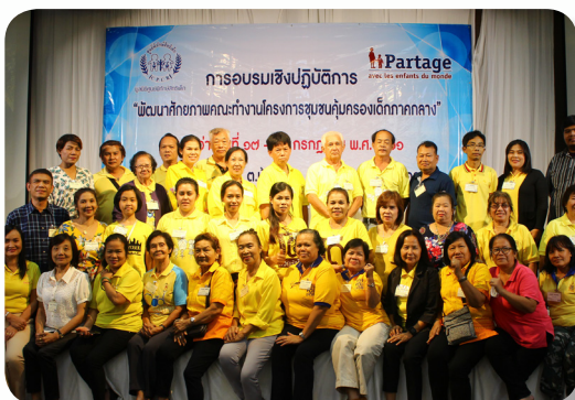
อบรมเชิงปฏิบัติการคณะกรรมการชุมชนคุ้มครองเด็กภาคกลาง