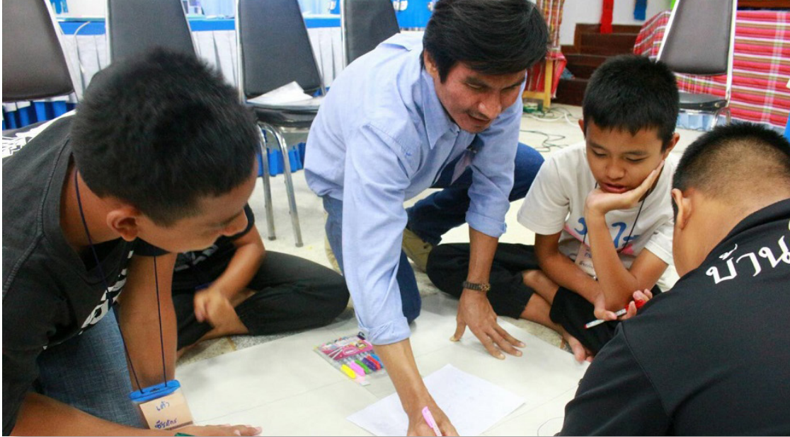
การทำแผนที่จุดเสี่ยงของชุมชนสันมะค่า