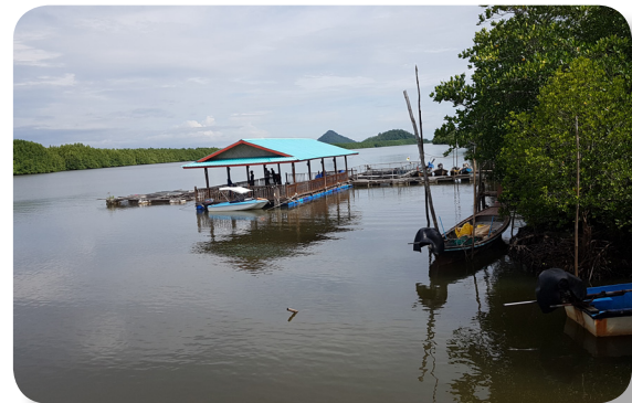
จุดเสี่ยงในชุมชน

จากการดำเนินงานชุมชนคุ้มครองเด็ก ทำให้ชุมชนมีการดำเนินงานเรื่องความปลอดภัยกับเด็กอย่างเป็นรูปธรรมและมีความเข้มแข็ง ได้แก่