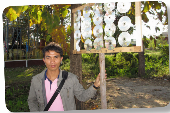
ทำป้ายไฟกระพริบเตือน

3. เจ้าหน้าที่เทศบาลได้เข้าไปพูดคุยกับเจ้าของร้านเกมส์เพื่อขอความร่วมมือไม่ให้เด็กที่อายุต่ำกว่า 18 ปีมาเล่นเกมที่ร้านในช่วงเวลาเรียนและไม่ให้เด็กในช่วงประถมศึกษาเข้ามาใช้บริการที่ร้านเกมส์เลย เนื่องจากพบว่ามีเด็กในชุมชนหนีไปเล่นเกมในช่วงเวลาเรียนและในช่วงวันหยุดมีเด็กมาเล่นเกมที่ร้านเป็นระยะเวลานานเกินไปจนส่งผลกระทบต่อ การดำเนินชีวิตของเด็ก