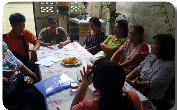
ประชุมทีมเตรียมความพร้อมในชุมชน

ในการทำงานเรื่องความปลอดภัย มูลนิธิฯ มุ่งเน้นให้ชุมชนได้เห็นปัญหาด้วยตนเองและเชื่อมให้หน่วยงานในพื้นที่และคนในชุมชนมาช่วยกันแก้ไขปัญหาด้านจุดเสี่ยง โดยมีกระบวนการทำงานดังนี้