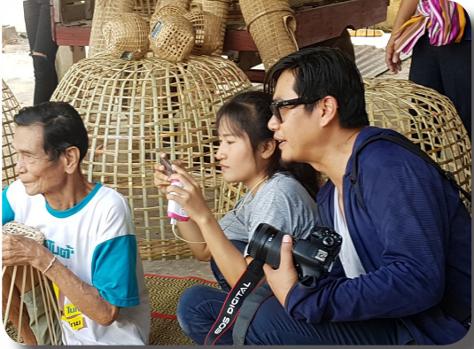
สอนเด็กทำสื่อชุมชน

โครงการชุมชนคุ้มครองเด็กมีเป้าหมายเพื่อพัฒนาให้ชุมชนในพื้นที่ที่มีการดำเนินงานใน 3 ระดับ