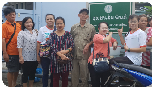
ทีมนักวิจัยชุมชน

คือ การผลักดัน ช่วยเหลือ สนับสนุนให้ชุมชน อันได้แก่องค์กรปกครองส่วนท้องถิ่น ผู้นำชุมชน เช่น ผู้ใหญ่บ้าน คณะกรรมการหมู่บ้าน เครือข่ายผู้ปกครอง หรือ พ่อแม่อาสาจัดให้มีการจัดสภาพแวดล้อมที่ปลอดภัยต่อเด็กและครอบครัวในชุมชนเพื่อลดความเสี่ยงในการเกิดอันตรายจากอุบัติเหตุ ภัยสังคมและภัยจากบุคคลอันตราย อาทิ การเดินสำรวจจุดเสี่ยงการแก้ไขจุดเสี่ยง การวางระบบหรือมาตรการเพื่อลดความเสี่ยงด้านต่างๆ การจัดกิจกรรมเพื่อลดความเสี่ยงหรือเพิ่มความปลอดภัยให้กับเด็กและครอบครัวในชุมชน เป็นต้น