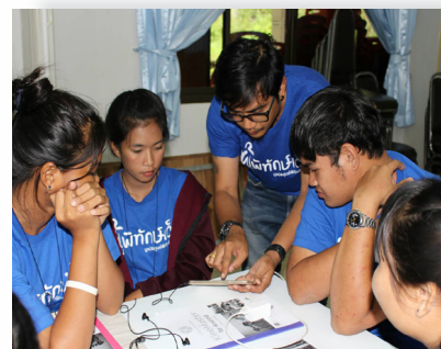
การจัดกิจกรรมพัฒนาเยาวชน จ.ขอนแก่น