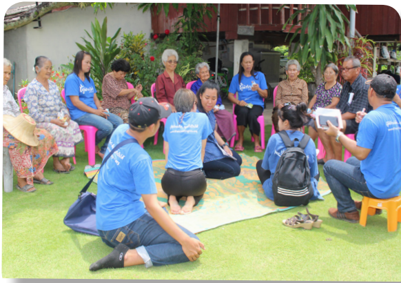
สภาเด็กและเยาวชนเก็บข้อมูลประวัติศาสตร์