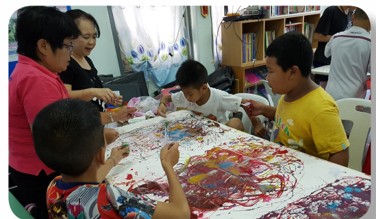
เครือข่ายพ่อแม่อาสาทำกิจกรรมกับเด็กในชุมชน