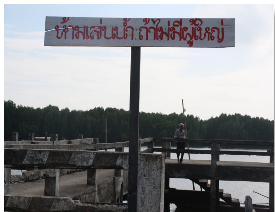
บริเวณที่เด็กชอบมาเล่นน้ำในช่วงหลังเลิกเรียน (ในช่วงน้ำขึ้นน้ำจะเต็ม)

1.4จัดอาสาสมัครลาดตระเวนดูแลตามแหล่งน้ำโดยอาสาสมัครและผู้นำชุมชนจะมีวิทยุติดตามเพื่อส่งข่าวสารถึงกัน