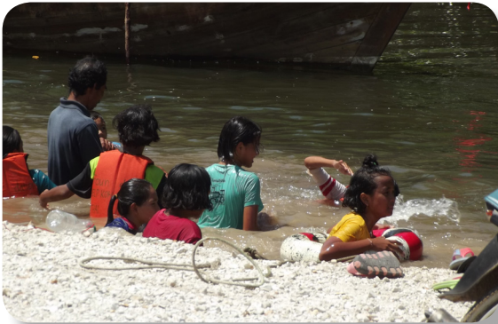
สร้างความคุ้นเคยกับน้ำ