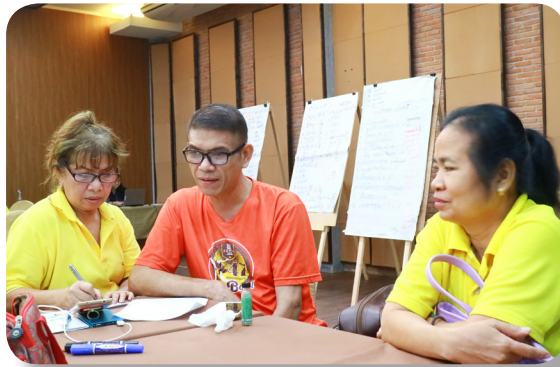
การอบรมพัฒนาทีมในการดำเนินงาน

ตั้งแต่ ปี พ.ศ.2554 มูลนิธิฯ ได้มีการดำเนินงานชุมชนคุ้มครองเด็กกับพื้นที่แห่งนี้ ได้แก่ การ WORKSHOP สสำรวจจุดเสี่ยง การประเมินสถานะเด็กและครอบครัวในชุมชนโดยใช้เครื่องมือ 19 ก้าวหนึ่ง การทำงานช่วยเหลือเด็กและครอบครัวโดยจัดประชุม CASE CONFERENCE ในชุมชน การทำกิจกรรมส่งเสริมพัฒนาเด็กและครอบครัว เช่น ค่ายครอบครัวใช้ชีวิตร่วมกัน จ.สระแก้ว การสอนเด็กถ่ายทำสารคดี เป็นต้น