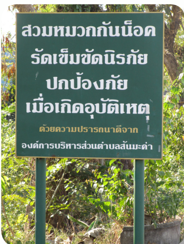
ทำป้ายเตือน

4. นำรถแบ็กโฮมาปรับพื้นที่ริมตลิ่งไม่ให้ลาดชันและทำราวกันแหล่งน้ำเนื่องจากเคยมีเหตุเด็กจมน้ำและมีการ ลื่นล้มบริเวณริมตลิ่งแต่บริเวณจุดนี้ยังทำไม่ครบทั้งหมด เนื่องจากใช้งบประมาณค่อนข้างสูงมาก