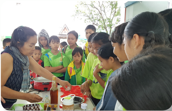
กิจกรรมเยาวชนเรียนรู้ภูมิปัญญา

ทางเทศบาลมีการทำงานกับเด็กและเยาวชนในสภาเด็กและเยาวชนตำบลสันมะค่า โดยการผลักดัน สนับสนุน ส่งเสริมให้เด็กและเยาวชนเข้ามามีบทบาทในการทำงานกับผู้คนในชุมชนเกือบทุกเรื่องไม่ว่าจะเป็น ผู้สูงอายุ สิ่งแวดล้อม ผู้พิการ และเด็ก โดยเข้ามามีส่วนร่วมในทุกขั้นตอน ตั้งแต่การร่วมพิจารณาปรับโครงการหรือกิจกรรมจากภายนอก ร่วมออกแบบวางแผน ดำเนินงาน สรุปผลการดำเนินงาน จนกระทั่งปัจจุบันสภาเด็กและเยาวชนตำบลสันมะค่าถือเป็นหนึ่งในกลไกหลักที่คอยขับเคลื่อนงานของเทศบาลนอกจากนี้จากการที่สภาเด็กและเยาวชนได้เข้าร่วมเป็นนักวิจัยชุมชนและได้สำรวจชุมชนในพื้นที่ พบว่าสถานการณ์เสี่ยงที่เกิดขึ้นกับเด็กและเยาวชนมากที่สุด คือ 1.เด็กมีเพศสัมพันธ์ในวัยเรียน 2.ปัญหาความรุนแรงในครอบครัว (พ่อแม่ด่าทอ/ทุบตีลูกหลาน ไล่ลูกหลานออกจากบ้าน พ่อแม่มีอาชีพขายเสื้อผ้าและปล่อยให้ลูกหลานอยู่บ้านตามลำพัง) 3.ปัญหาขยะในชุมชน ทั้ง 3 เรื่องนี้จึงกลายเป็นยุทธศาสตร์ในการทำงานของสภาเด็กและเยาวชนเทศบาลตำบลสันมะค่า โดยที่ผ่านมากลุ่มสภาเด็กและเยาวชนฯ ได้เป็นวิทยากรถ่ายทอดความรู้เรื่องความปลอดภัยทางเพศไปสู่พื้นที่ตำบลโรงช้าง ตำบลศรีโพธิ์เงิน ตำบลสันมะค่า และเป็นวิทยากรถ่ายทอดเทคนิคในการถ่ายภาพ/ทำหนังสือสั้นให้แก่ ต.ห้วย-ยาบ ต.โรงช้าง และต.เชียงแสน จนทำให้พื้นที่นั้นได้รับรางวัลรองชนะเลิศ มีการลงพื้นที่เก็บข้อมูลและให้ความช่วยเหลือแก่พ่อแม่วัยใส สร้างคลิปหนังสือสั้นที่สะท้อนเรื่องราวของเด็กวัยรุ่นในชุมชนให้แก่คนในพื้นที่โดยใช้ชื่อว่าหนังสือกลางโบสถ์