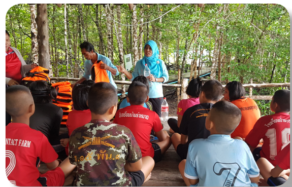
ครูและชุมชนสอนว่ายน้ำให้กับเด็กพื้นที่ใกล้เคียง

หลังจากมีการดำเนินงานอย่างต่อเนื่องทำให้มีชุมชนใกล้เคียงให้ความสนใจที่จะไปศึกษาเรียนรู้การทำสระว่ายน้ำธรรมชาติ โรงเรียนและชุมชนใกล้เคียงสนใจที่จะนำหลักสูตรทักษะการเอาตัวรอดทางน้ำไปให้กับนักเรียนในโรงเรียนในชุมชน ต่อมาในปี 2560 จึงได้มีการประสานงานระหว่างโรงเรียนและชุมชนบ้านร่าหมาด กับ โรงเรียนและชุมชนบ้านคลองยาง นำเด็กนักเรียนของโรงเรียนบ้านร่าหมาดมาเรียนที่สระว่ายน้ำธรรมชาติในชุมชนบ้านคลองยาง และให้ทีมงานของโรงเรียนและชุมชนบ้านคลองยางมาเป็นผู้สอนเด็กด้วย และชุมชนบ้านร่าหมาดได้เข้าสู่โครงการชุมชนคุ้มครองเด็กด้วยเช่นกัน