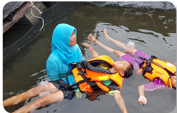
ฝึกลอยตัวในน้ำ