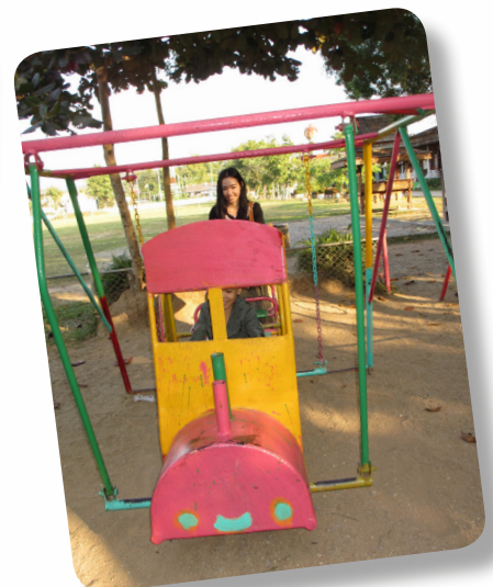
เครื่องเล่นที่ซ่อมแซมเสร็จแล้ว