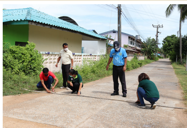
๓ ทีมนักวิจัยชุมชนทำลูกกระพอนความปลอดภัยด้วยเชือกประมง

ปัจจุบันกลุ่มนี้ได้จดทะเบียนเป็นองค์กรสาธารณประโยชน์โดยใช้ชื่อว่า ชมรมวิจัยชุมชนตำบลบ่อแดง (ปี 2563) ชมรมนี้มีส่วนร่วมและสนับสนุนการดำเนินงานเฝ้าระวังความปลอดภัยให้กับเด็กๆ ในตำบล เช่น ติดตามดูแลให้คำปรึกษากับครอบครัวของเด็ก การให้ข้อมูลเด็กและครอบครัวเพิ่มเติมกับหน่วยงานต่างๆ