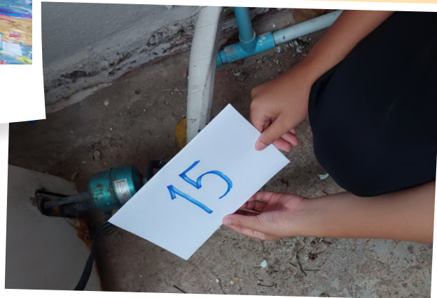
๙ การสำรวจจุดเสี่ยงในชุมชน