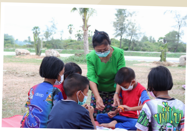
๓ ชุมชนทำกิจกรรมสร้างสุข ชายหาดแสนสุข