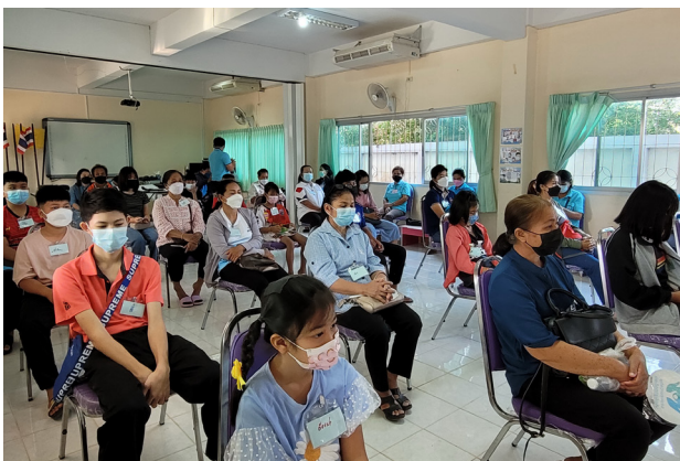
๘ อบรมสำรวจจุดเสี่ยง

ในปี 2565 มีข้อมูลจากชุมชนในการเฝ้าระวังบุคคลอันตรายที่ใช้ยาเสพติด ป่วยจิตเวชใช้อาวุธ ทำร้ายคนในชุมชน คณะทำงานในชุมชนเกิดการตื่นตัวมากขึ้น มีการจัดอาสาสมัครคอยดูแลและแจ้งเหตุเตือนภัยให้กับผู้นำชุมชนทุกหมู่บ้านทราบและผู้นำหมู่บ้านกำชับผู้ปกครองในการดูแลเด็กอย่างใกล้ชิด โดยเฉพาะเด็กที่อยู่ใกล้เคียงกับบุคคลอันตรายเหล่านั้น มีการประสานงานกับตำรวจและโรงพยาบาลที่เกี่ยวข้อง