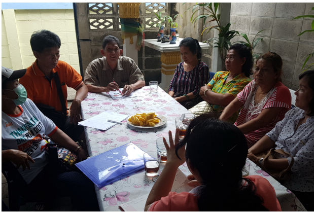
๘ ประชุมคณะทำงานที่เกี่ยวข้องทั้งระดับผู้บริหาร และระดับปฏิบัติการ