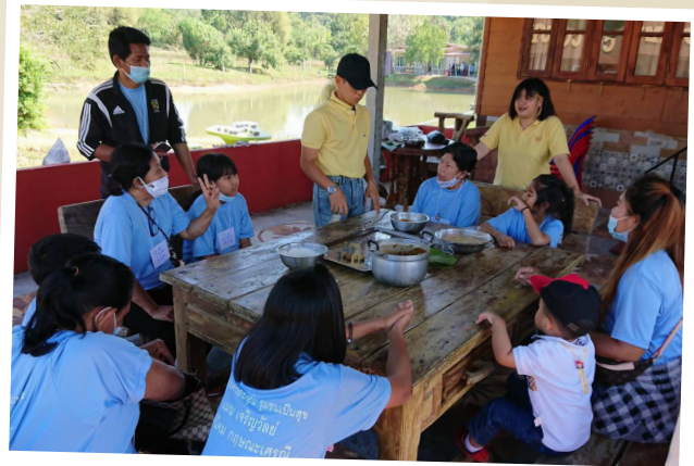
๓ เด็กและครอบครัวเรียนรู้การทำขนมไทย