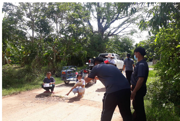
* ทีมสำรวจจุดเสี่ยง