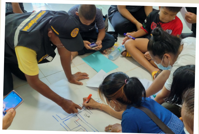
๘ วาดแผนที่จุดเสี่ยงและวางแผนแก้ไขปัญหา