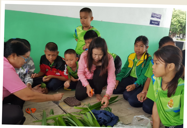
๙ ชุมชนทำกิจกรรมส่งเสริมพัฒนาเด็ก