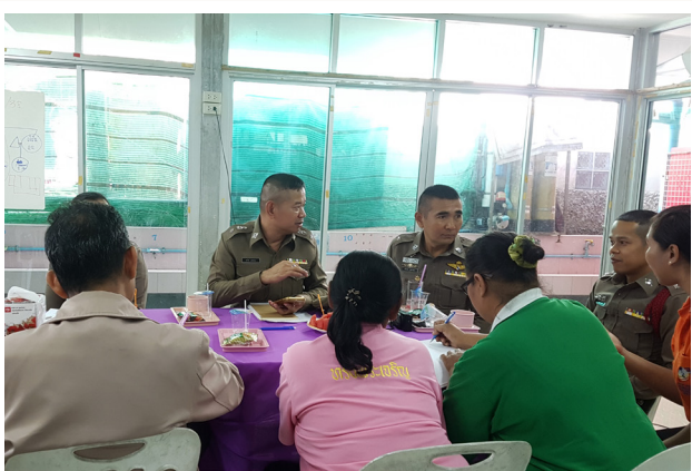
๓ ประชุมทีมสหวิชาชีพเพื่อให้การช่วยเหลือเด็ก

ในปี 2562 มีการสำรวจการใช้ความรุนแรงในครอบครัวและมีการสำรวจเด็กกลุ่มเสี่ยงในพื้นที่พบว่า มีเด็กส่วนหนึ่งอยู่อาศัยกับปู่ย่าตายาย บางคนอยู่ในครอบครัวที่ใช้สารเสพติดและมีพฤติกรรมการใช้ความรุนแรงต่อผู้อื่น ผู้ปกครองที่เป็นปู่ย่าตายายส่วนใหญ่ขาดทักษะในการเลี้ยงดูเด็ก มีการใช้ความรุนแรงกับเด็ก ทำให้เด็กส่วนหนึ่งมีพฤติกรรมก้าวร้าว ใช้ความรุนแรงกับผู้อื่น ขาดเรียนบ่อยและเด็กหลายคนเข้าไปเกี่ยวข้องกับยาเสพติด จึงทำให้มีการจัดประชุม Case conference ร่วมกับทีมสหวิชาชีพในพื้นที่เป็นระยะๆ ในการวางแผนให้ความช่วยเหลือเด็กกลุ่มเสี่ยงและครอบครัว คณะทำงานที่เป็นครูมีทักษะในการลงเยี่ยมบ้านและการทำงานกับเด็กกลุ่มเสี่ยง