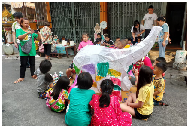
๒ เด็กๆ ในชุมชนมีความสุขกับศิลปะ

ประธานและคณะกรรมการชุมชนมีความตั้งใจและให้ความสนใจในปัญหาของเด็กในทุกเรื่อง และมีการสื่อสารเพื่อขอความช่วยเหลือมายังหน่วยงานที่เกี่ยวข้อง นอกจากนี้ยังให้ความสำคัญกับการให้เด็ก ในชุมชนได้มีโอกาสต่างๆ จึงได้ระดมทรัพยากรจากหน่วยงานในพื้นที่จัดกิจกรรมให้เด็กทุกปี