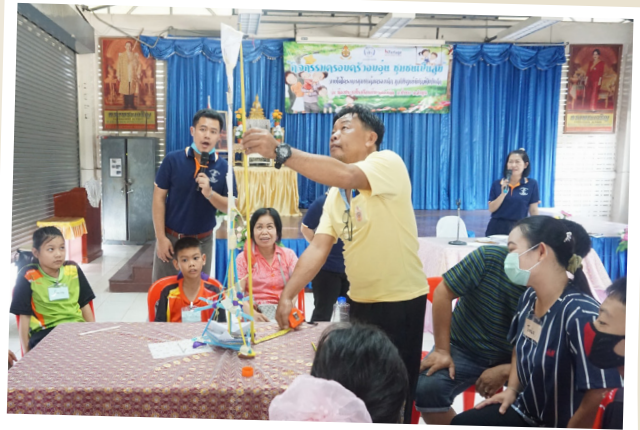
๓ กิจกรรมเสริมความสัมพันธ์กลุ่มครอบครัว