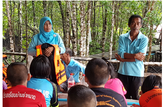
๓ ชุมชนสอนความปลอดภัยทางน้ำ

ชุมชนบ้านไร่หมาดและบ้านขุนสมุทร ได้เข้าร่วมโครงการใน พ.ศ. 2559 คณะทำงานในชุมชน ได้มีการดำเนินงานการสำรวจจุดเสี่ยงในชุมชนและโรงเรียนบ้านไร่หมาด หลังจากการสำรวจจุดเสี่ยงพบว่าหลายจุดมีความไม่ปลอดภัยกับเด็ก ชุมชนได้ระดมกำลังกันในดำเนินการแก้ไขทั้งในโรงเรียนและชุมชน เช่น การทำป้ายเตือน การรื้อถอนสิ่งปลูกสร้างที่ชำรุด การจัดระเบียบการจอดรถในชุมชน การซ่อมแซมสิ่งต่างๆ ปรับสถานที่ในชุมชนและโรงเรียน