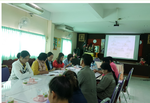
๘ การประชุมร่วมกับเครือข่ายในพื้นที่