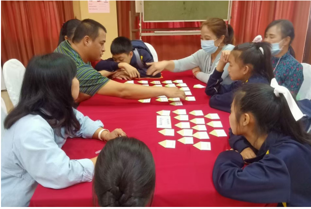
๓ ครอบครัวเรียนรู้ปัจจัยที่ทำให้ครอบครัวไม่มีความสุข