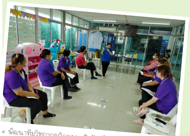
๙ พัฒนาศักยภาพกรกิจกรรมตัวฉันทันเป็นองฉันทัน