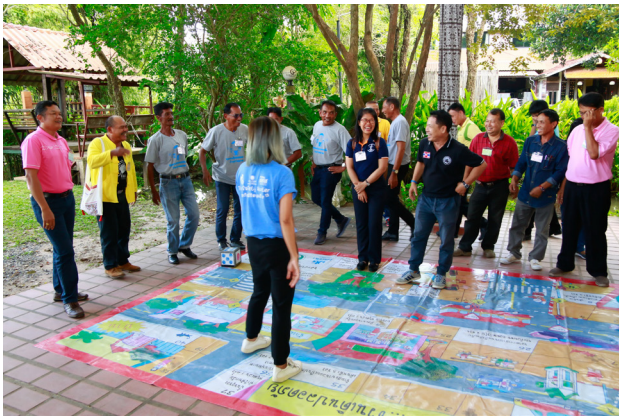
๙ ให้ความรู้เรื่องความปลอดภัย