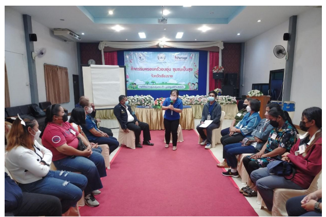
๘ ห้องเรียนพ่อแม่

เดิมทีเทศบาลตำบลสันมะค่ามีแนวทางการทำงานที่สนับสนุนและส่งเสริมให้เด็กเยาวชนเข้ามามีบทบาทในการทำงานร่วมกับชุมชนเป็นทุนเดิมอยู่แล้ว เช่น งานประเพณีวัฒนธรรม หรือการจัดงานต่างๆ ในชุมชน และในการดำเนินงานชุมชนคุ้มครองเด็กเทศบาลตำบลสันมะค่าก็ได้ดึงเอาสภาเด็กและเยาวชนเข้ามามีส่วนร่วมในการทำงานอย่างต่อเนื่อง โดยมอบหมายให้เลขานุการนายกเทศมนตรีตำบลสันมะค่า รองปลัดเทศบาลตำบลสันมะค่า เจ้าหน้าที่ที่รับผิดชอบดูแลสภาเด็กและเยาวชน กำกับติดตามงานและเป็นพี่ปรึกษาให้กับสภาเด็กและเยาวชน จากช่วงแรกที่สภาเด็กเยาวชนจะรับผิดชอบกิจกรรมกลุ่มสัมพันธ์ หลังจากนั้นสภาเด็กฯ ค่อยๆ ขยับบทบาทมาเรื่อยๆ จนทำหน้าที่ในการให้เนื้อหาเรื่องความปลอดภัย เช่น การสำรวจพื้นที่สร้างสรรค์-ไม่สร้างสรรค์และจุดเสี่ยงในชุมชน และทำหนังสือเสนอข้อเสนอบริหารจัดการ