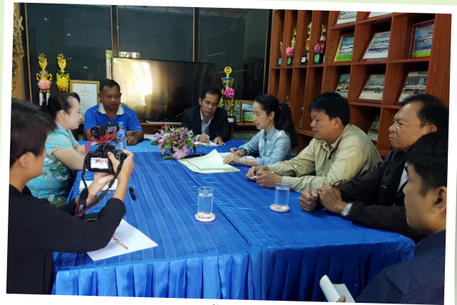
๙ ประชุมหารือความร่วมมือกับพื้นที่